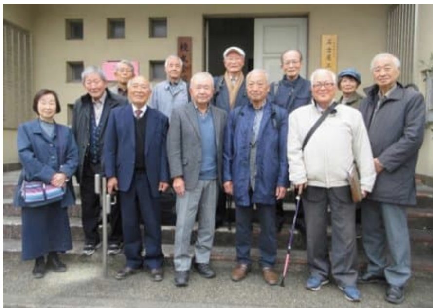
11 時 30 分 校友会館集合