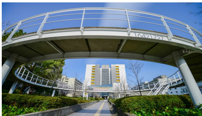
ニュートンリング